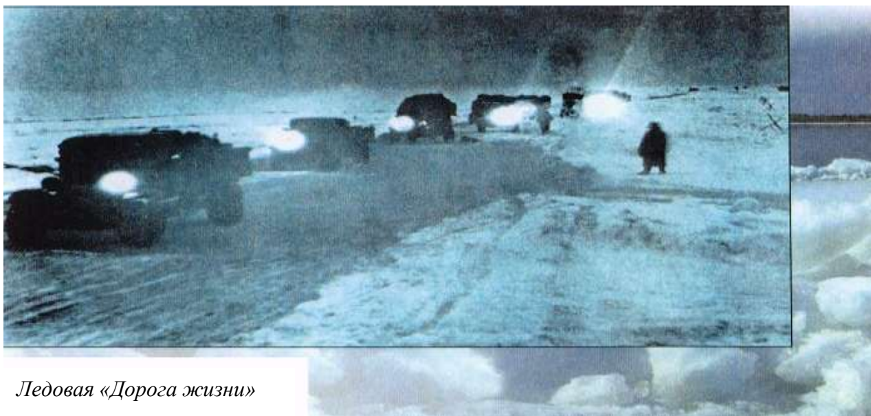
Ледовая «Дорога жизни»