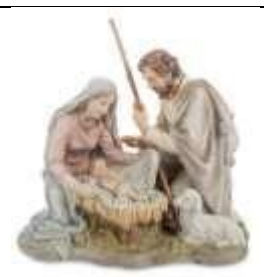
Б) Рождество Христово